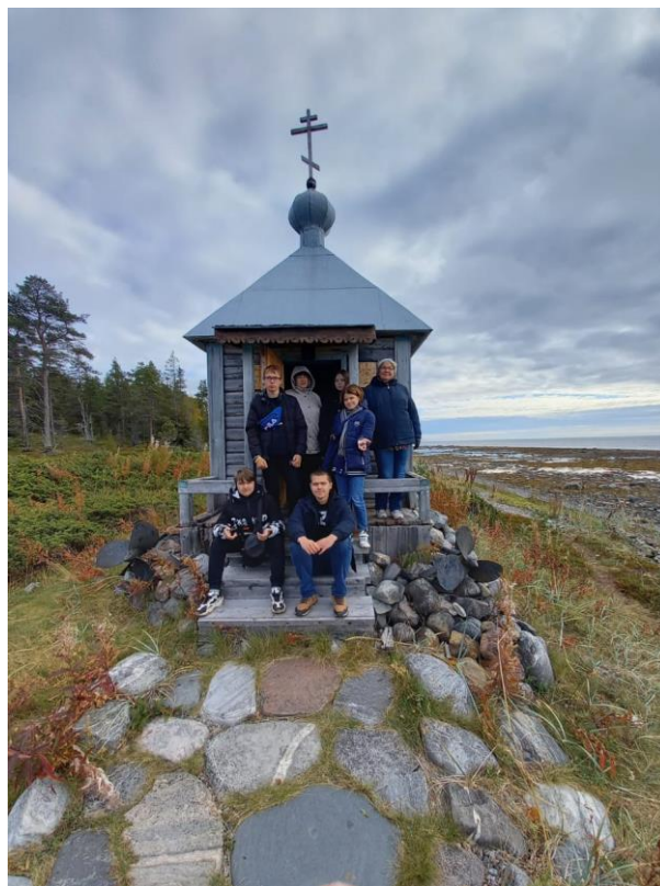
Группа проекта «ВКонтакте»

Сложившаяся ситуация, целевые ориентиры государственной образовательной политики в сфере воспитания обуславливают процесс поиска новых подходов, форм и методов работы по духовно-нравственному воспитанию школьников.